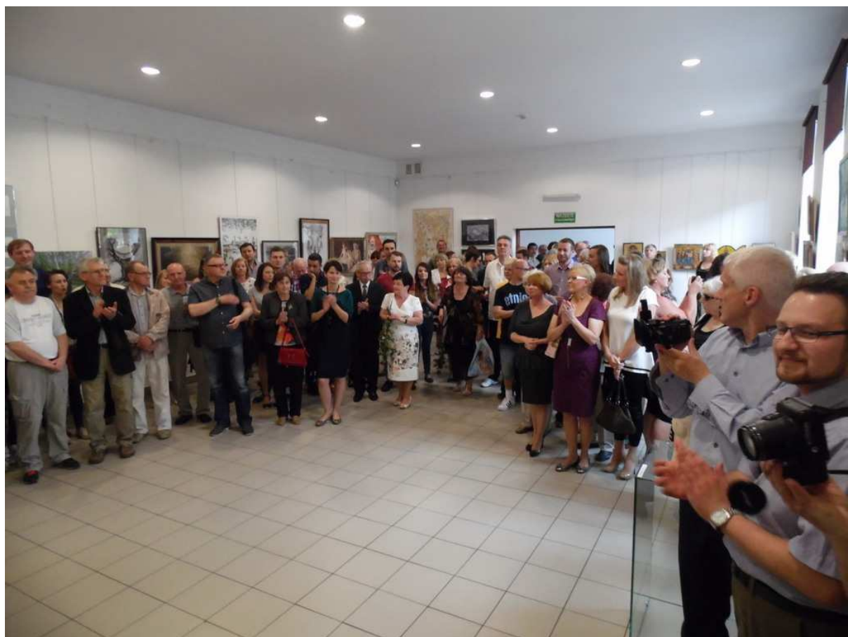
Doroczna Wystawa Artystów Olkuskich 2016

Galeria olkuska przykłada ogromną wagę do promowania miejscowego środowiska artystycznego i własnej kolekcji malarstwa współczesnego, w której znajduje się już ponad 550 prac twórców polskich i zagranicznych – o wysokiej wartości artystycznej i materialnej. W Roku Jubileuszowym zaplanowano w Olkuszu dwie istotne wystawy artystyczne prezentujące dorobek miejscowych artystów: tradycyjna, doroczna Wystawa Artystów Olkuskich oraz wystawa najcenniejszych prac olkuskich twórców (w tym również dzieła z Kolekcji Sztuki Współczesnej BWA w Olkuszu). Ta druga wystawa prezentowana jest obecnie w Galerii BWA „U Jaksy” w Miechowie. Obu wystawom będą towarzyszyć okazałe albumy, których wydanie uświetni Rok Jubileuszowy. Tego typu prezentacje i wydawnictwa są dla artystów, którzy obdarowują Galerię swoimi pracami, dowodem, że warto wzbogacać olkuszą kolekcję, bo ich obrazy, grafiki, rzeźby nie trafiają do magazynu, ale są pokazywane na wystawach i zamieszczane w wydawnictwach, tym samym promują twórców i ich dorobek.