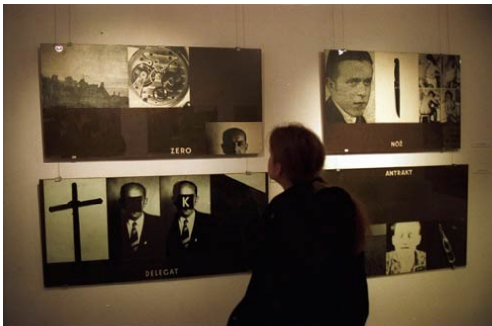
Gdańsk, Pałac Opatów, wystawa "Zdzisław Beksiński - Fotografie z lat 1953 - 1959, z kolekcji Muzeum Narodowego we Wrocławiu".