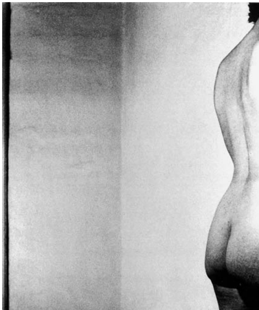
Zdzisław Beksiński - Akt, 1958, brom, 39,2 x 26,2cm. Wystawa w Galerii Fotografii Muzeum Narodowego w Gdańsku