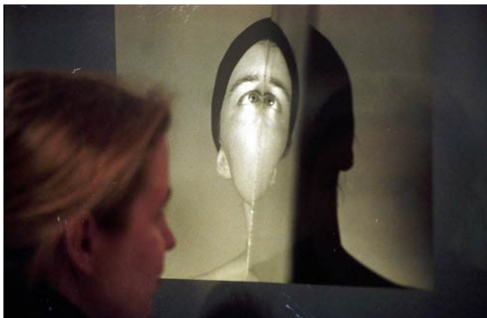
Gdańsk, Pałac Opatów, wystawa "Zdzisław Beksiński - Fotografie z lat 1953 - 1959, z kolekcji Muzeum Narodowego we Wrocławiu".