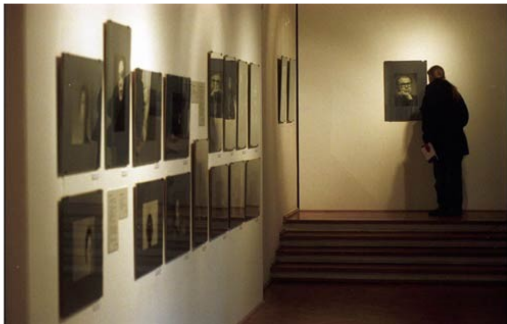
Gdańsk, Pałac Opatów, wystawa "Zdzisław Beksiński - Fotografie z lat 1953 - 1959, z kolekcji Muzeum Narodowego we Wrocławiu".