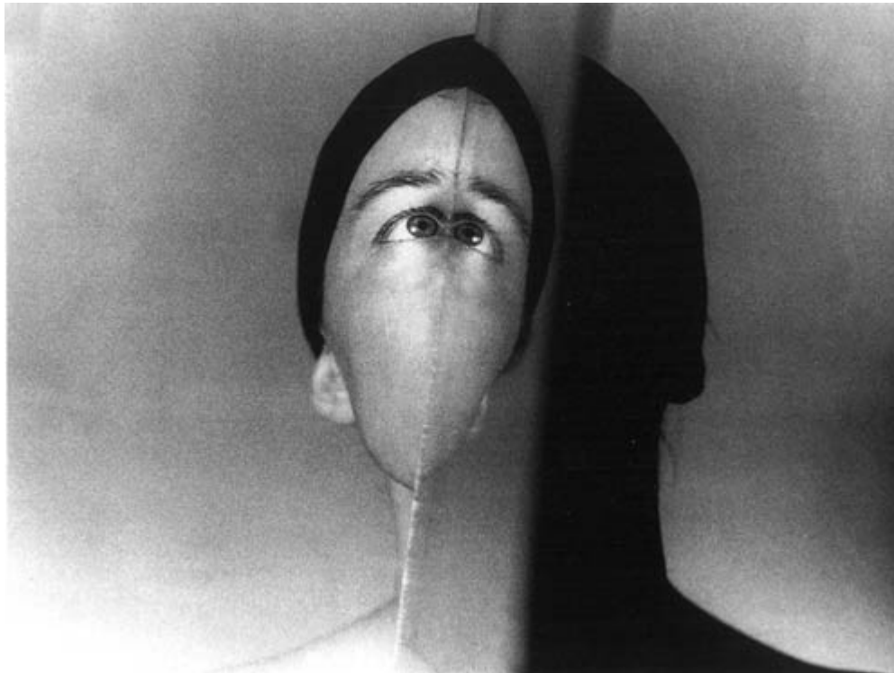
Zdzisław Beksiński - Strefa, 1957, brom, 28,5 x 37,8cm. Wystawa w Galerii Fotografii Muzeum Narodowego w Gdańsku