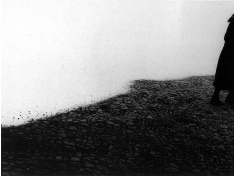
Zdzisław Beksiński - Odchodząca, ok. 1957, brom, 29 x 38,7cm. Wystawa w Galerii Fotografii Muzeum Narodowego w Gdańsku