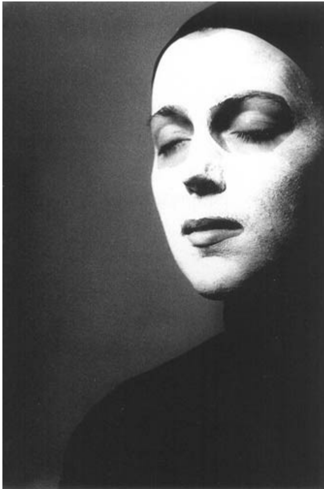
Zdzisław Beksiński - "Z", 1957, brom, 38,6 x 26,4cm. Wystawa w Galerii Fotografii Muzeum Narodowego w Gdańsku

Najbardziej eksperymentalne są fotografie abstrakcyjne. Część to specjalne, zacierające cechy przedmiotu ujęcia fragmentów otaczającej rzeczywistości - murów, siatek, ogrodzeń, lodu, drutów, tkanin. Pozostałe to zapisy eksperymentów ze światłem i cieczami. Ciekawe są struktury powstałe w wyniku zapisu ruchu wiązek światła - inżynieryjne, bądź zupełnie swobodne białe linie na czarnym tle lub na zachmurzonym niebie. Jest coś bardzo muzycznego a jednocześnie technicznego w tych kompozycjach. Prace w podobnej konwencji pojawiają się dość często w latach 60., Beksiński zrobił swoje fotogramy w 1958 roku. Odrębny, surrealistyczny świat tworzą abstrakcyjne, nieregularne, kontrastowe fotografie cieczy. Przypominają niektóre prace Zbigniewa Dłubaka z końca lat 40. lub Bronisława Schlabsa, który prowadził podobne eksperymenty w tym samym czasie co Beksiński. Nie mogą dziwić wzajemne inspiracje obu artystów, którzy wraz z Jerzym Lewczyńskim tworzyli w 2 poł. lat 50. nieformalną grupę - prowadzili