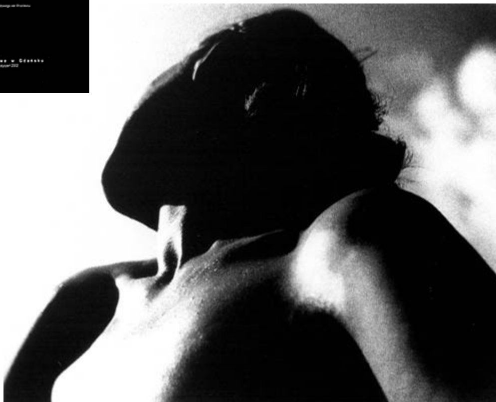
Zdzisław Beksiński - Tors, 1953, brom, 37,5 x 47,7cm. Wystawa w Galerii Fotografii Muzeum Narodowego w Gdańsku

Muzeum Narodowe w Gdańsku lipiec 2011 - kwiecień 2012