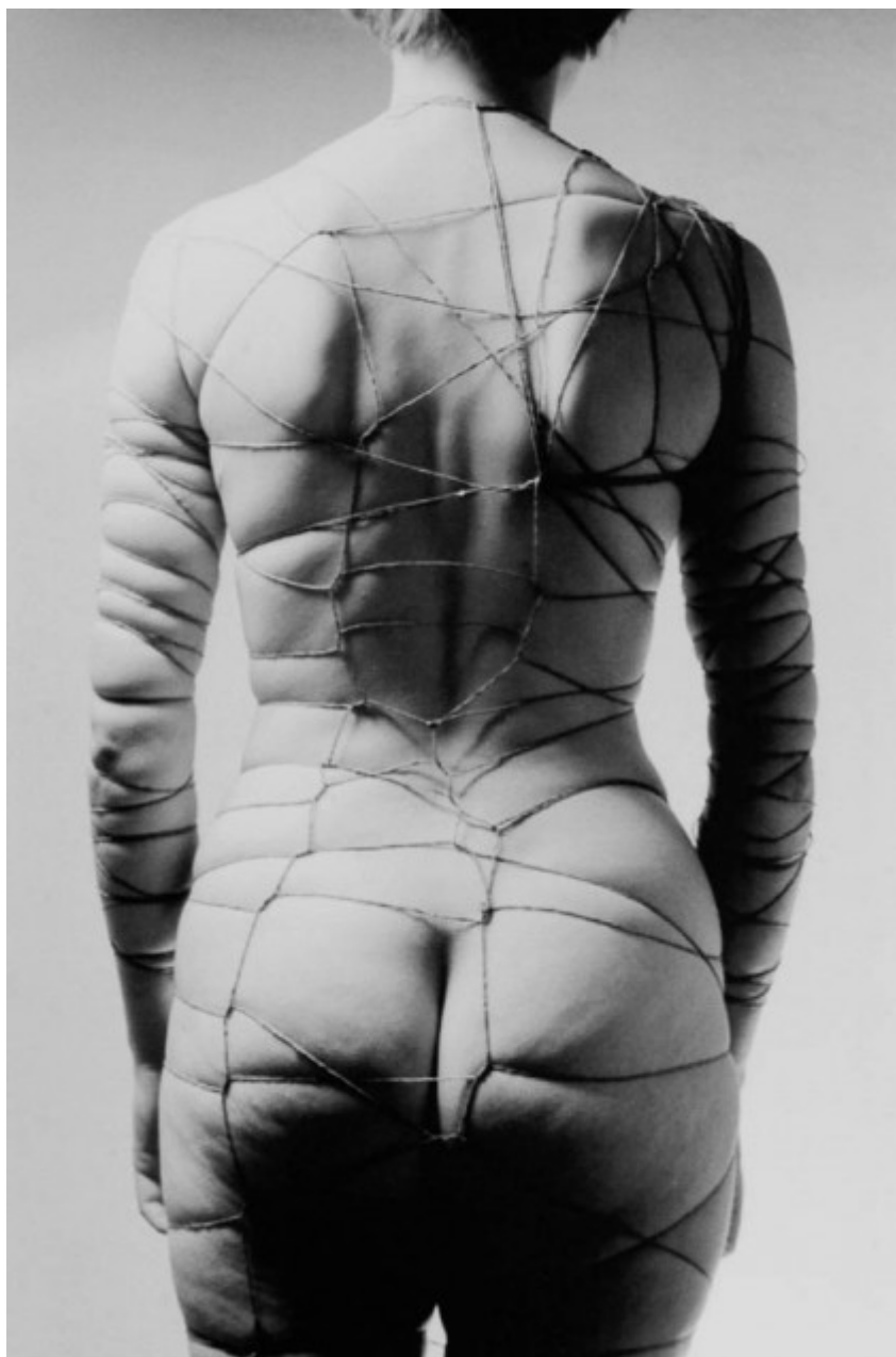
Study for the Sadist's Corset 3, lata 50.

Książka Grzebałkowskiej ma jeszcze jedną warstwę, fascynującą nie tylko dla miłośników twórczości Beksińskiego. Otóż śledząc losy głównego bohatera, poznajemy świat sztuki schyłku PRL-u i pierwszej dekady demokracji. To doskonale uzupełnienie dominującego dziś obrazu, który składa się z epokowych dzieł, uznanych nazwisk (Libera, Kozyra, Bałka...), koturnowych legend (jak ta o sztuce krytycznej) i głośnych wystaw. Tymczasem nie sposób dostrzec całej złożoności życia artystycznego doby transformacji bez wypieranego rewersu: starych-nowych elit, które kompetencje kulturowe wyniosły jeszcze z poprzedniego ustroju, dzikiego rynku sztuki, reklamówek pełnych gotówki (tak samo wypieramy „szczęki”, łóżka polowe i bazy), w końcu – społecznego i medialnego uwielbienia dla twórców takich jak Beksiński czy Jerzy Duda-Gracz. 2005 rok to koniec pewnej epoki: umierają wtedy Oskar Hansen i Jerzy Jarnuszkiewicz. Ale również śmierć Beksińskiego jest symboliczna: domyka okres transformacji polskiego pola sztuki, ery arte polo, braku spójnych narracji, czasu negocjacji tego, co „wypada”, a co już nie. Obecnie, po ćwierćwieczu, wszystko jest proste, „unieruchomione” – by odwołać się do tytułu brawurowego tekstu Zofii Krawiec i Łukasza Rondudy („SZUM” nr 5), którzy w nawiązaniach do estetyki BDSM w twórczości takich twórców jak Jakub Julian Ziolkowski,